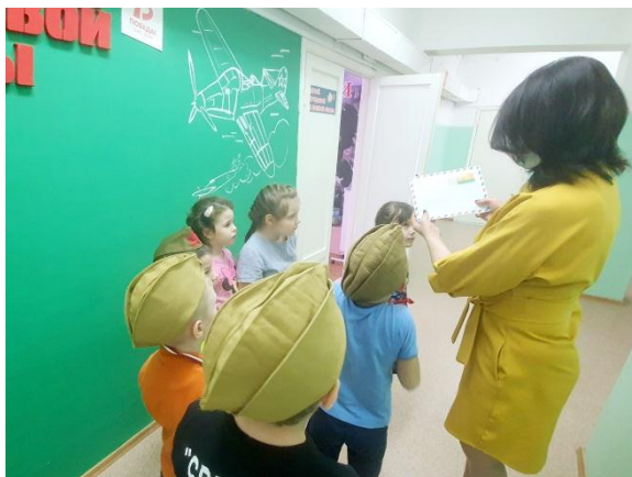
Ведущий читает письмо.

Ведущий 2. Продолжая эту тему, ребята, хочу сказать, что сегодня к нам в детский сад пришло письмо (приложение 1) и я предлагаю вам его прочесть.